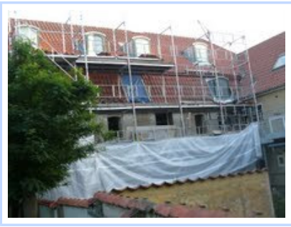
P1010578.JPG 3389K View Download