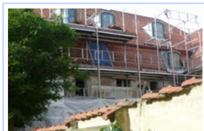
Ingen vinduer i den nederste mansard.JPG 3318K View Download